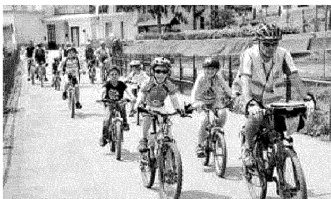
Un gruppo di bimbi sulla Ciclovía