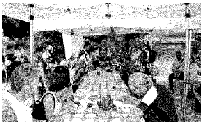
Uno dei punti di ristoro lungo il percorso