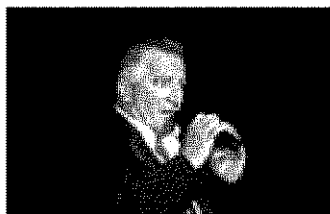
Giuseppe Tassi canta "Uomini soli" dei Pooh